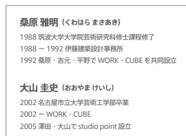
桑原 雅明 (くわはら まさあき)

1988 筑波大学大学院芸術研究科修士課程修了 1988 ~ 1992 伊藤建築設計事務所 1992 桑原・吉元・平野で WORK・CUBE を共同設立